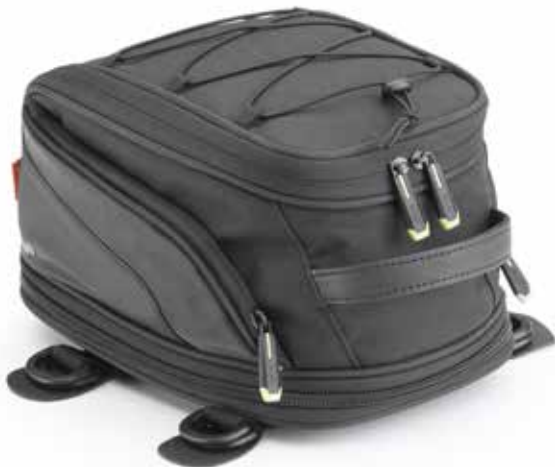
Borsa da coda universale, 11 lt. Universal tail bag, 11 lt.

SACCHETTO: LDPE 4 RACCOLTA PLASTICA SACCHETTO: PP 5 RACCOLTA PLASTICA HANGTAG: PAP 21 RACCOLTA CARTA GARANZIA: PAP 22 RACCOLTA CARTA